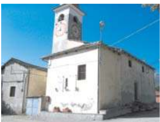
Uno dei lavori che si andrebbe a realizzare interessa la frazione di Rocchetta

Qualora questi dovessero essere ritenuti rispondenti alla suddetta normativa, saranno finanziati mediante i trasferimenti previsti a favore delle Comunità Montane per il "servizio idrico