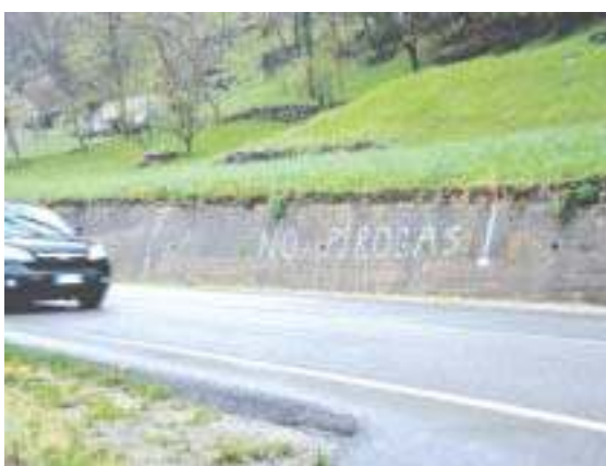
La scritta di protesta contro la centrale, su un muro della provinciale Paesana-Crissoles

Ma, la nuova assise della Conferenza, se vogliamo, in ordine cronologico non è l'ultima "novità" che la questione dell'impianto a biomassa offre alla cronaca.