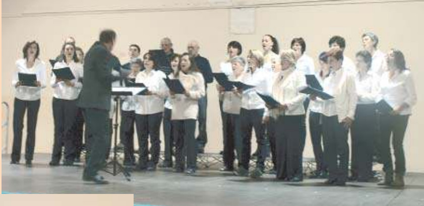
Nelle foto due rappresentazioni legate ad attività portate avanti dall'Università di Valle: un gruppo di coristi (sopra) ed il corso di balli country (a sinistra)