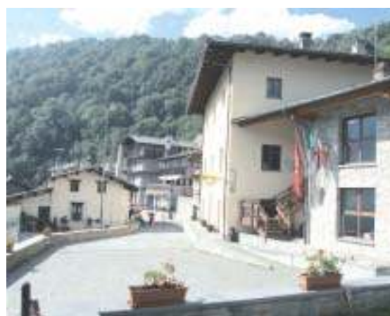
Uno scorcio del centro di Ostana